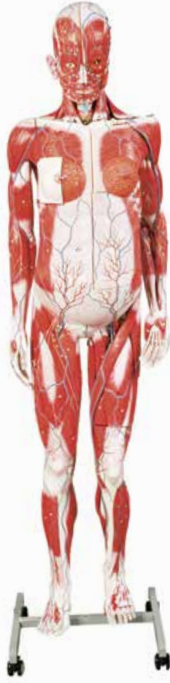
11005-000 人体解剖模型 女子 B-150 形