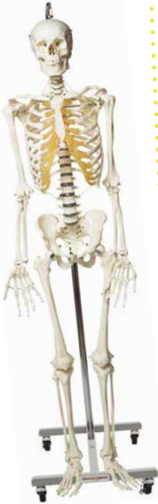
11011-000 人体骨格模型 男子 SA-160 形