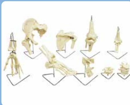
11021-000 関節種類模型 9種(12部位)