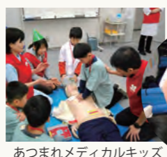
あつまれメディカルキッズ

○多面的な活動展開く大阪市大のすべての医療人と市民をまきこんで ■河合塾医療体験ツアー ■あつまれメディカルキッズ(今回は2010年12月開催予定) ■生活科学部の体験ツアー ■オープンキャンパス ■大阪府下の看護学校教員へのBLSコース開催 ■院内AED講習会 ■共同研究開発 医療シミュレータ製作メーカーとのコラボ やいやいの会 この活動を支えるすべてのスタッフが一堂にあつまり、「やいやい」と大きな声で思いっきり意見を述べ合い運営をしている。ここからエネルギーが生まれる。 *大阪府