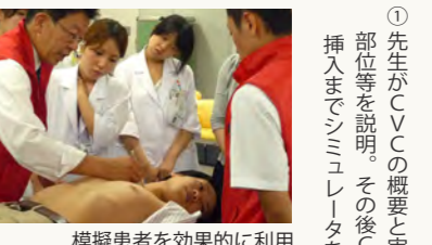
模擬患者を効果的に利用

●中心静脈穿刺手技(CVC)講習会の実際・手順 ① 先生がCVCの概要と実習内容を説明。初めに模擬患者で穿刺部位等を説明。その後CVC手技の準備から本穿刺、カテーテル挿入までシミュレータを使いデモンストレーション。 ② 受講者を2名1組に分け、1名が実施者、1名が介助者となつて実習。 ※原則的には2名の受講者に対して1名のインストラクター。 【ポイント①】 ※インストラクターや介助者は実施者が手技を行う際にはアドバイスを一切しない。 成功・不成功にかかわらず15分間で手技を終了。 ③ 終了後、インストラクターと実習者、介助者の3名で debriefing (振り返り)。 【ポイント②】 ※まず、介助者、受講者の順にインストラクターが良かった点や注意すべき点を確認し、その後受講者に、インストラクターが実習内容を簡潔に総評。 ④ 実習者と介助者が交代し、③と同じ展開で実習、debriefingを行い実習を終了。完了後、実習のまとめ。 【関連文献】 「模擬患者とシミュレータの併用によるCVC講習会」 松浦由観、首藤太一ほか。医学教育2010、41巻：291-294