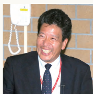
大阪市立大学大学院医学研究科 総合診療センター/卒後医学教育学 准教授 医学博士

プロフィール 1963年大阪市出身。大阪市立大学医学部・同大学大学院を卒業し、第2外科助手に。外科医として約2000例の手術を手かけ、平成17年からは総合診療センターで卒後医学教育学を担当、後輩の育成にも熱心に取り組む。