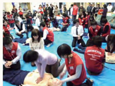
病院玄関ホールでの住民対象 AED 講習会