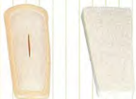
腕部本体 1 (支持枠付) 皮膚スベア 1枚