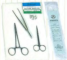
器具一式 (持針器、ピンセット、ハサミ、針、糸)