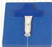
腸管本体 1 (支持台+模擬腸管1本) *支持台は血管と共通