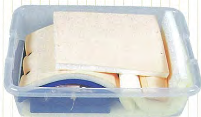
専用ケース 1個 (約51×36×H15cm)