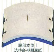
腹部本体 1 (支持台+模擬腹部)