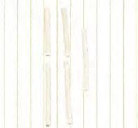
血管用スベア 5本 (*支持台は腸管と共通で使えます。)