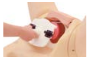
子宮口開大度モジュールはワンタッチでセット可能