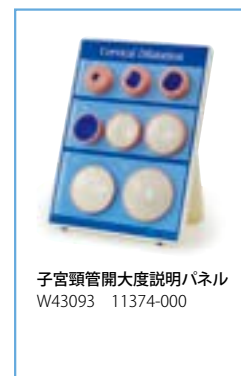
子宮頸管開大度説明パネル W43093 11374-000