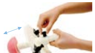
胎児下降度(-3~+3)もレバーで簡単設定