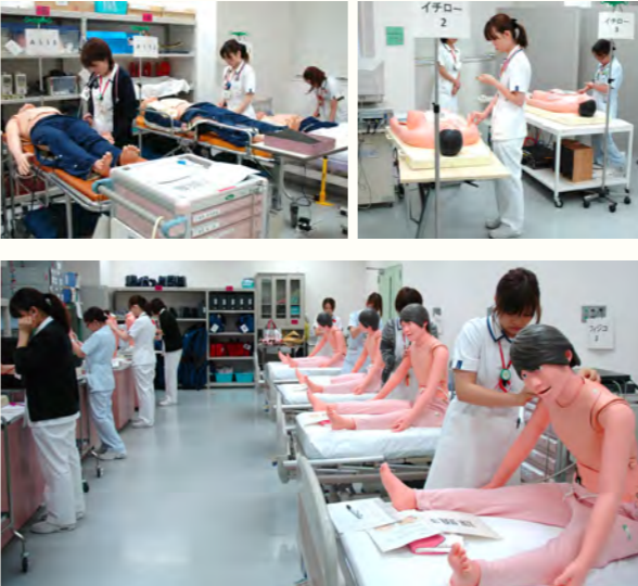
テストに臨む4月に入職した新人看護師

★評価の方法と運用 呼吸・循環のフィジカルアセスメント技術の評価は、「フィジコ」「イチロー」「ラング」などのシミュレーターを使って行い、とくに評価テストの前にはスタッフが入念にシミュレータの機能をチェックしています。アウトカム達成度の評価方法は、実技では9問中9問正解、知識テストでは15問中12問をクリアすると次に進むことができます。テストに合格するまでは何度でもトレーニングを繰り返すことができ、合格に至るトレーニング回数の平均値などもデータ化しています。加えて、症例によるレベル達成度の違いや、達成後もその能力が維持できるかについてもデータ化を試みています。