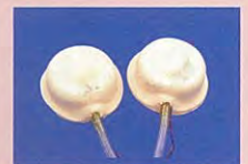
ホッホシュテッタセンサー 左右組 11213-030