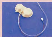
クラークの点センサー 左右組 11213-040