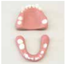
11408-030 疾患歯(アドバンスド用) 上下1組