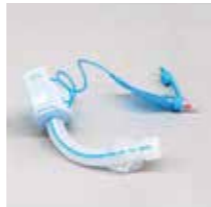
12746-020 PORTEX 気管切開 チューブⅡ