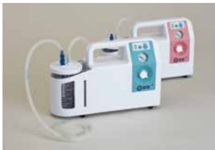
YM-19 12203-200 ミント YM-19 12203-210 ピンク 小型吸引器 3WA-750S