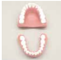
11408-020 義歯(アドバンスド用) 上下1組