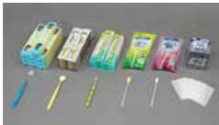
MY-1 12022-100 口腔ケア体験セット