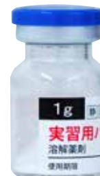
KNG-3 12023-400 実習用バイアル 1g (溶解薬剤タイプ)