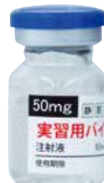
KNG-3 12023-300 実習用バイアル 50mg (注射液タイプ)