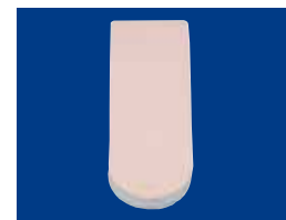
腕の皮膚 5枚組 11219-010