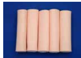
腸管 5本組 11219-070