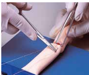
腸管吻合トレーニング