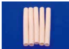
血管 5本組 11219-050