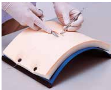
腹部皮膚縫合トレーニング