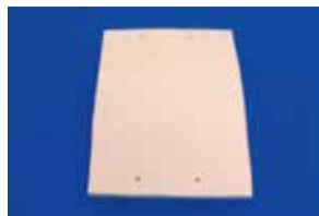
腹部 1枚 11219-030