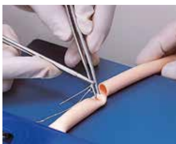
血管吻合トレーニング