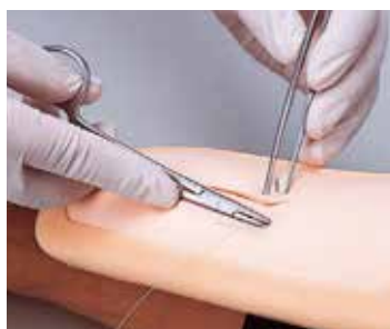
腕部皮膚縫合トレーニング