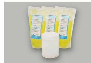
11229-070 模擬痰/模擬水様便 150ml×3袋