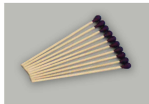
11402-010 着色用綿棒(青) 10本組