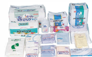
KT-26 12660-000 おむつ交換実習セット

様々なタイプのオムツとオムツ交換実習時に必要となる制菌予防衣や手袋などをセットにしています。