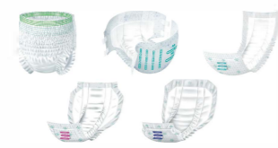
KU-21 12314-070 大人用紙おむつセットB 小クラス単位

様々なタイプのオムツとオムツ交換実習時に必要となる制菌予防衣や手袋などをセットにしています。