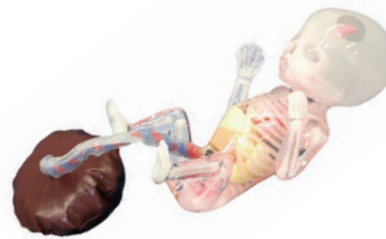
Modelo de Feto para Demostración Incluye un modelo de feto de tamaño real para demostración y entendimiento visual.