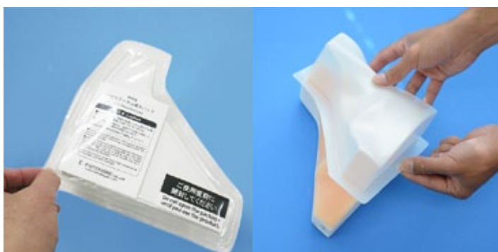
1. パッド裏側のフィルムをはがし、パッドを取り出します。