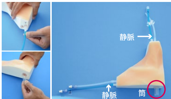
2. 血管チューブ4本(静脈：青色 / 動脈：透明 各2本)と、透明の筒(静脈パイプ)をパッドに取り付けます。