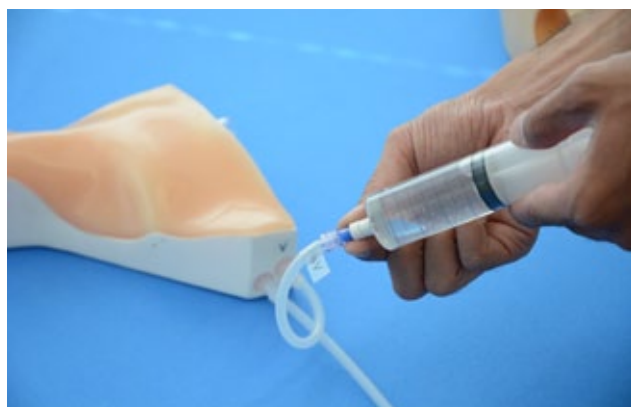
3. 水を入れた50mlのシリンジをチューブにつないで、ゆっくりと水を100ml注入し、血管チューブ内を模擬血液で満たします。