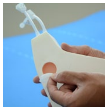
1. ランドマーク穿刺の際は、裏側のキャップを外してください。