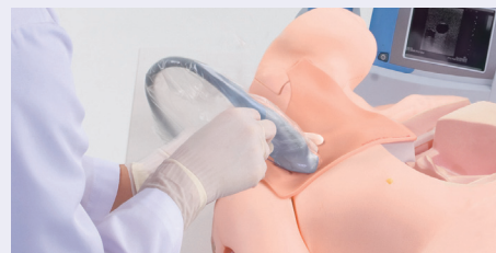
Almohadilla de Punción Ecoguiada