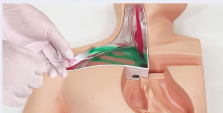
Bloque anatómico transparente