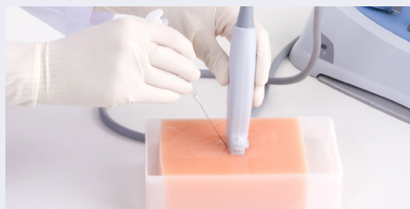
Bloque de entrenamiento de ultrasonido