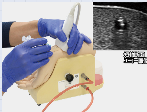
短軸断面 エコー画像

エコーガイド下動脈穿刺パッド (11351-110) は、超音波診断装置によるエコーガイド下血管穿刺が可能です。解剖学的にリアルな血管の走行を再現しています