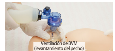
Ventilación de BVM (levantamiento del pecho)