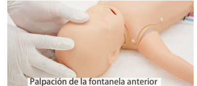
Palpación de la fontanela anterior