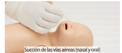
Succión de las vías aéreas (nasal y oral)