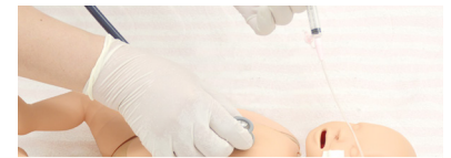
Alimentación por sonda (nasal y oral) (confirmación de colocación del tubo con sonidos de brubjeo)