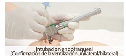
Intubación endotraqueal (Confirmación de la ventilación unilateral/bilateral)