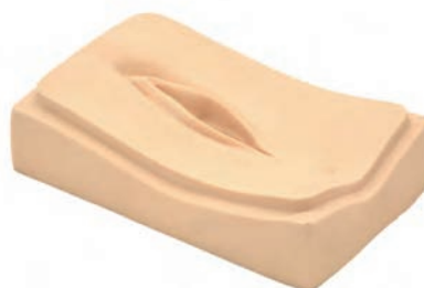
外陰部皮膚2枚組(会陰縫合用)