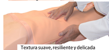
Textura suave, resiliente y delicada