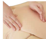
産じょく子宮触診 トレーニングセット