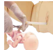
分娩介助 トレーニングセット