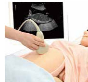
超音波検査 トレーニングセット