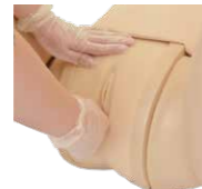
妊婦内診 トレーニングセット