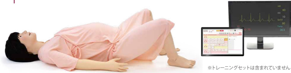
※トレーニングセットは含まれていません