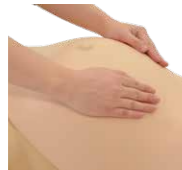
妊婦腹部触診 トレーニングセット