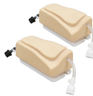
超音波ガイド下による橈骨動脈 の穿刺トレーニング エコーガイド下動脈穿刺パッド M99 11351-110