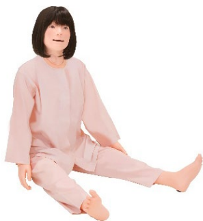
卒前教育から実践レベルまで 活用できる看護実習モデル 万能型看護実習モデル “八重” MW25 11404-000