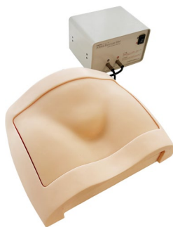
鼠径部から大腿動脈穿刺の トレーニング 大腿動脈採血シミュレータ MW82 11486-000