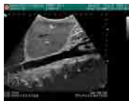
US 正中矢状走査断面