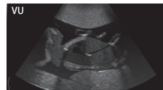
Corazón con cuatro cámaras