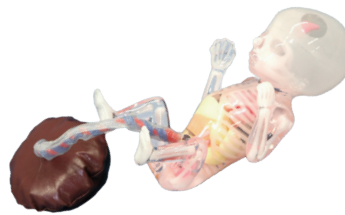
Modelo de Feto para Demostración Un modelo del feto de tamaño real para demostración y entendimiento visual está incluido.